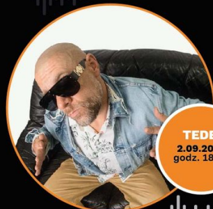
TEDE 2.09.2023 godz. 18:30