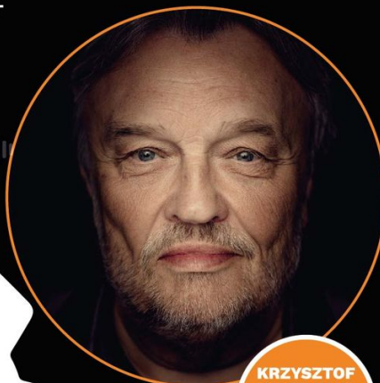
KRZYSZTOF CUGOWSKI z Zespołem Mistrzów 3.09.2023 godz. 20:30