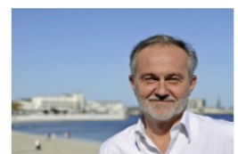
Wojciech Szczurek prezydent Gdyni

- Bardzo miłe informacje w niedzielny wieczór. Zostałem nominowany do