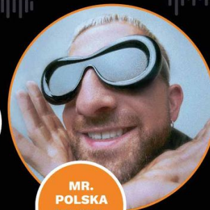
MR. POLSKA 2.09.2023 godz. 20:00

STREFA GASTRO STREFA PARTNERÓW MŁODZIEŻOWY ART PATROL STREFA AKTYWNOŚCI PARK ROZRYWKI