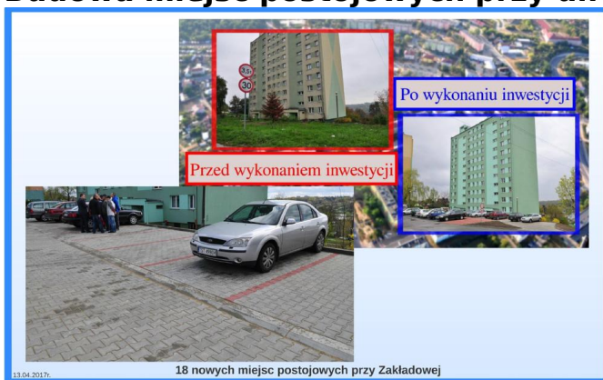
18 nowych miejsc postojowych przy Zakładowej

Cel: Budowa miejsc postojowych dla samochodów osobowych. Poprawa bezpieczeństwa ruchu drogowego oraz wizerunku modernizowanego terenu przy ul. Zakładowej.