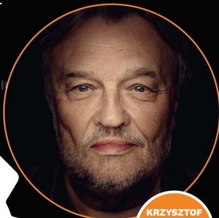
KRZYSZTOF CUGOWSKI z Zespołem Mistrzów 3.09.2023 godz. 20:30