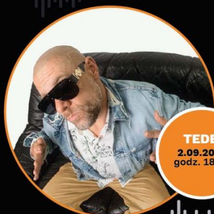
TEDE 2.09.2023 godz. 18:30