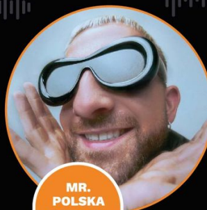
MR. POLSKA 2.09.2023 godz. 20:00

STREFA GASTRO STREFA PARTNERÓW MŁODZIEŻOWY ART PATROL STREFA AKTYWNOŚCI PARK ROZRYWKI