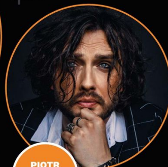
PIOTR CUGOWSKI 3.09.2023 godz. 19:00