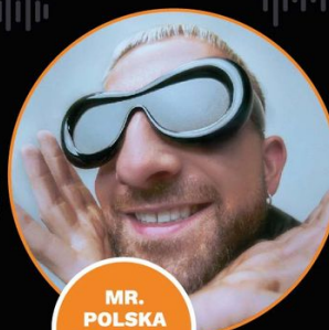
MR. POLSKA 2.09.2023 godz. 20:00

STREFA GASTRO STREFA PARTNERÓW MŁODZIEŻOWY ART PATROL STREFA AKTYWNOŚCI PARK ROZRYWKI