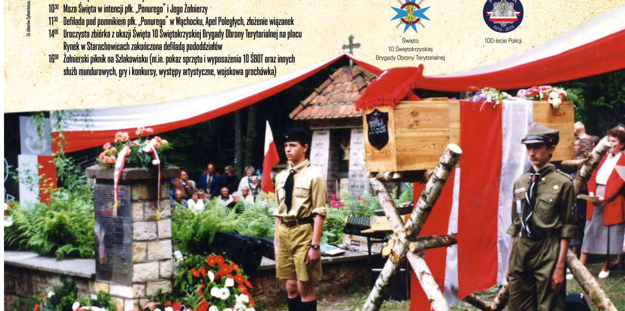
Wspieracie organizacyjnie i finansowo w organizacji uroczystości

Za obrazem: Dymitr Kozłowski, Internet: plk. „Ponury”