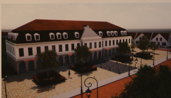
Projektowany plac miejski oraz Dom Kultury