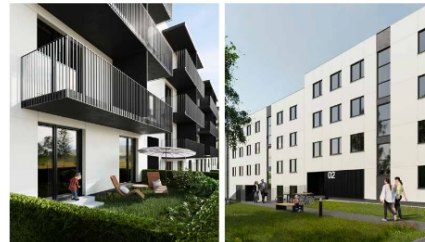
Zespół budynków mieszkalnych