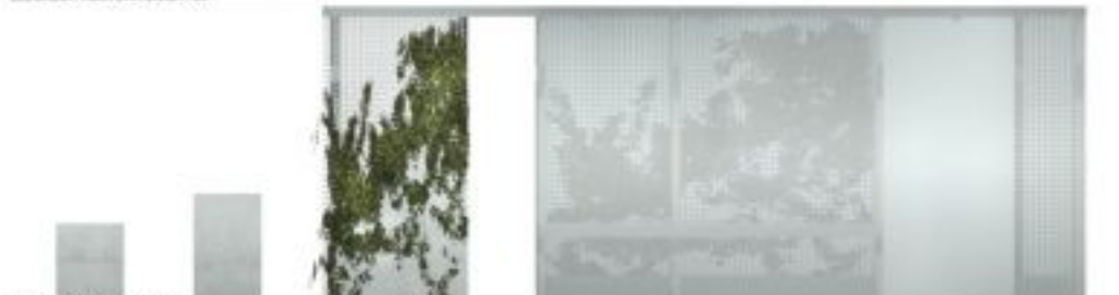
WIDOK TYLNY SKALA 1:20

II Miejsce (ex.) Praca nr 542862 - uzyskała w ocenie 418 punktów (na 600 możliwych)