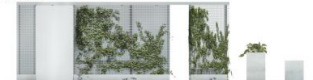
WIDOK POCZTYWY SKALA 1:20